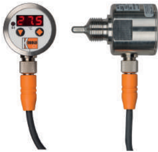
23327 - Temperaturschalter